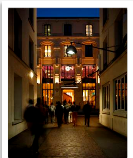
© C. Raynaud de Lage Maison des Métallos

Plongée dans l'histoire industrielle de Paris à son apogée, entre 1850 et 1940 : métallurgie, céramique, cuir, activités dont les traces sont toujours visibles malgré la gentrification. Parmi les sites visités : Maison des Métallos, agence Jean Nouvel, Cour des fabriques, faïencerie Loebnitz.